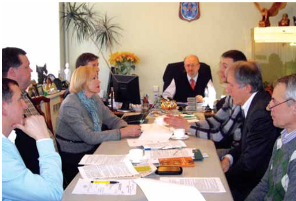
5 декабря 2011 года. Первое заседание рабочей группы по созданию «Национальной платформы бизнеса Беларуси-2012» в офисе ОО «МССПир».

Начиная с 2006 года, эксперты общественного объединения «Минский столичный союз предпринимателей и работодателей» и ведущих региональных бизнес-ассоциаций из Бреста, Витебска, Гродно, Могилева, совместно с научно-исследовательским центром Мизеса АЦ «Стратегия» и исследовательским центром ИПМ, при участии наиболее активных представителей белорусского бизнес-сообщества ежегодно разрабатывают «Национальную платформу бизнеса Беларуси». Будучи максимально полным сборником предложений по улучшению бизнес-климата в стране, Платформа является выражением консолидированной позиции делового сообщества. Проект Платформы ежегодно рассматривается на Ассамблее деловых кругов Республики Беларусь, в которой принимают участие учредители и руководители предприятий, представители более 40 бизнес-ассоциаций и общественных объединений социально-экономической направленности, а также научных кругов, руководители министерств и ведомств, сотрудники дипломатического корпуса, журналисты. Окончательный вариант Платформы дорабатывается с учетом предложений, прозвучавших на ассамблее, а также поступивших в Координационный совет по развитию Платформы в течение четырех недель после ассамблеи. Затем Платформа вручается высшим должностным лицам Республики Беларусь всех ветвей власти, руководителям министерств и ведомств, местных органов власти, членам Национального собрания Республики Беларусь.