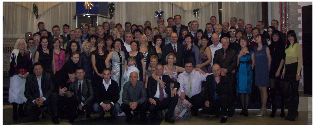
Коллективное фото членов Минского столичного союза предпринимателей и работодателей на память о праздничном мероприятии: проводах старого и встрече Нового года.

https://minsknews.by/kak-v-stolitse-vyistraivayutsya-vzaimootnosheniya-biznesa-i-vlasti/